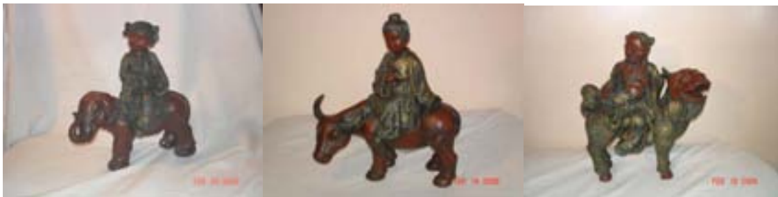
Bộ tượng các vị Đạo Sĩ cỡi thú, các con thú được cưỡi từ trái sang phải: Voi, Trâu, Long Mã (không rõ các nhân vật. Nhờ ở sự góp tay của các bạn đọc cho biết lai lịch và tiểu sử các nhân vật).

Điều trên đã chứng minh, ngoài hồn khóm, loài thú đã có những tiến hóa độc lập và phát triển thành những cá thể độc lập.