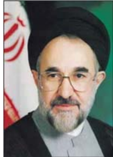
Tổng Thống Khatami